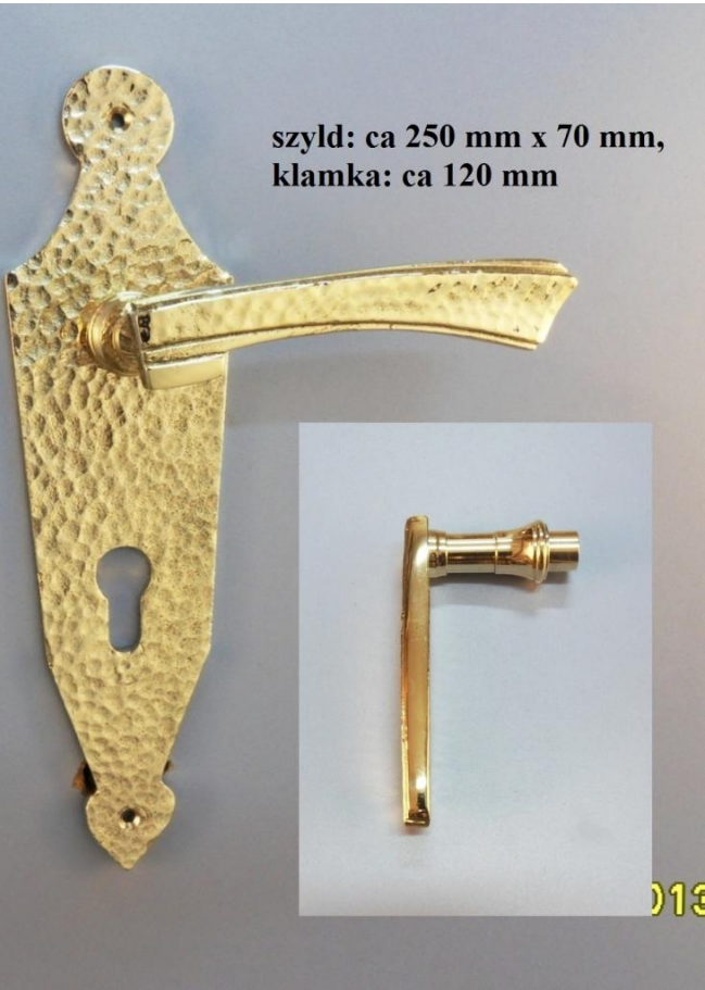
DETAL. KLAMKA I SZYLD